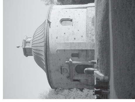
Site de captage d'eau à Munich

A. Carlin d'après Didier Jammes de Bio de Provence. Le completendu complet du voyage est disponible sur demande.