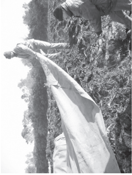
Chantier collectif de mise sous bâche du compost le 11 janvier 2006

En 2005, nous avons consolidé notre partenariat avec les Communautés des Communes du Pays de Sommières et du Pays de Lunel. Le groupe qui compte maintenant une quinzaine d'agriculteurs a mis à compost 600 t de matières premières (500 t de déchets verts et 100 t de fumier d'ovins) ; 150 t le seront au printemps. Les déchets verts broyés ont été mélangés au fumier, arrosés, mis en andain et recouverts par une bâche géotextile. Une étude de faisabilité est en cours. Elle doit permettre de définir les différentes possibilités pour la structuration d'un outil de production pérenne.