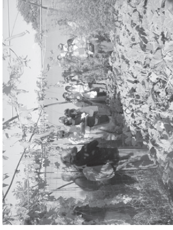
Jardin Ecole - Septembre 2005